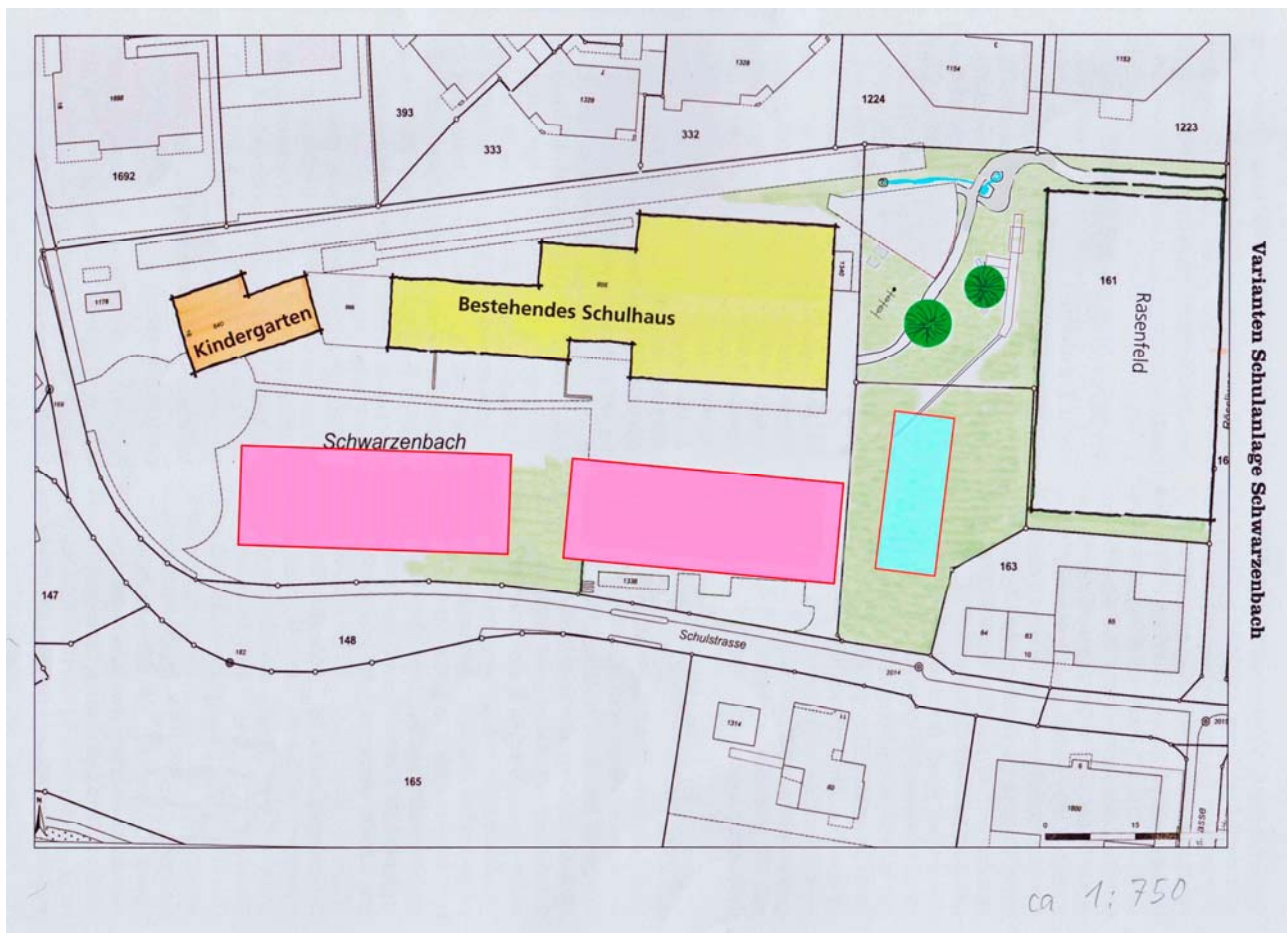
Abbildung 2: Schulanlage Alternativ-Vorschlag IGAA

Eine Südausrichtung von Bauten (Hitze) ist gemäss neueren Publikationen (ETH oder Zeitschrift Casanostra, Nr. 132, Vorzeigebauten etc.) und Auskünften von diversen Architekten mit klimatauglicher Planung, moderner Bautechnik und entsprechenden Materialien heute kein Problem mehr. Zudem gibt es heute auch interessante Möglichkeiten, Südfassaden zur Energiegewinnung zu nutzen. Das renovierte Kindergarten-Schulhaus hat auch eine Südfassade!