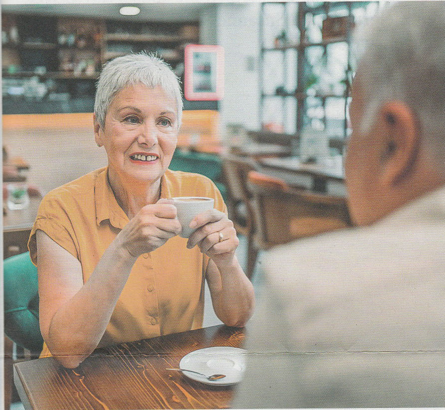
↑ Personen in der Pensionierung tauschen sich mit Menschen aus, die diese Phase des Übergangs bereits hinter sich haben. Im Mittelpunkt stehen eigene Erfahrungen, wie etwa zu den Themen Finanzen, Frühpensionierung, Tagesstruktur und Hobbys.

Persönlicher, lebensnaher Austausch statt Ratgeber: Hier setzt das Projekt «Living Library» an und bringt Menschen vor und nach der Pensionierung miteinander ins Gespräch.